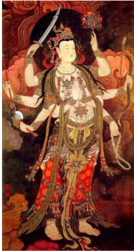
_Tôn Tượng ba mặt, 10 cánh tay: